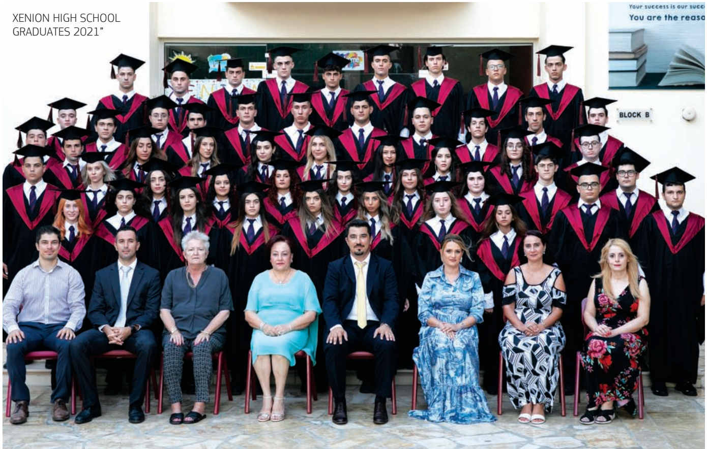
XENION HIGH SCHOOL GRADUATES 2021"

ηλεκτρονικούς υπολογιστές, τη λογοτεχνία, τη δημοσιογραφία, αλλά και με δραστηριότητες κοινωνικής ευαισθητοποίησης, προσφοράς και ψυχαγωγίας (φωτογραφία, κινηματογράφος, σκάκι). Σε όλες τις εξωδιδασκασίες μας δραστηριότητες ενισχύεται η γνώση και ενθαρρύνεται η ανάπτυξη δεξιοτήτων, μέσα από την ομαδικότητα, τον εθελοντισμό και τη δυναμική συμμετοχή. Επίσης, γίνεται η καθοδήγηση και προετοιμασία των μαθητών για συμμετοχή σε τοπικά, ευρωπαϊκά και διεθνή εκπαιδευτικά προγράμματα. Κατ' αυτόν τον τρόπο, δεν χάνεται διδακτικός χρόνος και οι μαθητές μας επωφελούνται με την ενεργό εμπλοκή τους, ώστε να γίνουν πιο δημιουργικοί, αυτόνομοι και δραστήριοι.