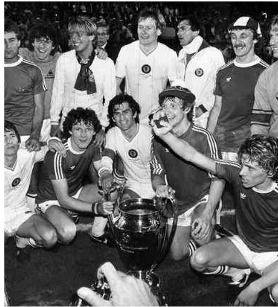
ΑΣΤΟΝ ΒΙΛΑ 1982

την Λάχι Φινλανδίας και στα ημιτελικά χρειάστηκε την 1η υπέρβαση (με την τότε πολύ ισχυρή Αντερλεχτ). Τα φαβορί αλληλοεξουδετερώθηκαν (η «Μπάρτσα» απέκλεισε Πόρτο, Γιουβέντους και η Αντερλεχτ την Μπάγερν), η Αγγλία είχε μόλις αποκλειστεί λόγω Χείζελ. Μάλιστα, παρ' ολίγον φινάλιστ στον τελικό να ήταν η Γκέτεμποργκ, που αποκλείστηκε από την Μπαρσελόνα στα πέναλτι.