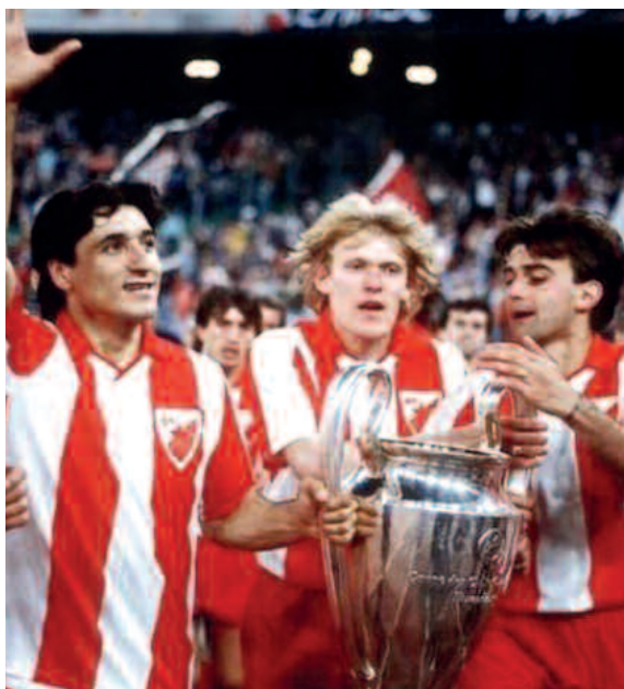
ΕΡΥΘΡΟΣ ΑΣΤΕΡΑΣ 1991