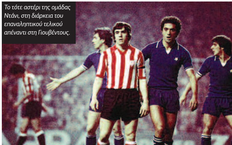
Το τότε αστέρι της ομάδας Ντάνι, στη διάρκεια του επαναληπτικού τελικού απέναντι στη Γιουβέντους.

Στο «Κομουνάλε» του Τορίνο η Μπιλμπάο πείστηκε στα πρώτα λεπτά και δέχτηκε γκολ στο 15' με τον Ταρντέλι. Στο υπόλοιπο του αγώνα είχε τις σιγμές για τέρμα, από την άλλη όμως η Γιουβέντους είχε περισσότερες. Τίγκα το «Σαν Μαμές» 14 μέρες μετά (18 Μαΐου), με 43 χιλιάδες κόσμο. Η απειρία του Αλεσάνκο έδωσε την ευκαιρία του σπουδαίο Μπέτεγκα μόλις στο 7' να μείνει ελεύθερος στην περιοχή και να ανοίξει το σκορ. Η Μπιλμπάο ήθελε τρία γκολ. Απάντηση άμεσα, στο 11' με τον Τσουρούκα. Πίεσε για το 2ο, έχασε ευκαιρίες (ο Τζοφ έκανε δύο σπουδαίες επεμβάσεις) και πέτυχε άλλο ένα γκολ που δεν μέτρησε (προηγήθηκε χέρι). Στην επανάληψη ο ρυθμός της δεν ήταν το ίδιο καλός, ανέβηκε και η Γιουβέντους. Η ανατροπή έμοιαζε αδύνατη, αλλά στο 83', από εκτέλεση κόρνερ, ο Κάρλος (μπήκε σαν αλλαγή) έκανε με κεφαλιά το 2-1. Η βασική ομάδα πίεσε στον λίγο χρόνο που απέμεινε για το 3ο γκολ, αλλά χωρίς αποτέλεσμα. Η κόουπα πήγε στο Τορίνο, η Μπιλμπάο έμεινε με τη μεγάλη προσπάθεια. Έναν μήνα μετά έχασε, όπως προαναφέραμε, και στον τελικό του κυπέλλου Ισπανίας. Η ομάδα εκείνη έκανε άλλη μία καλή χρονιά (3η τη σεζόν '77-'78) και άρχισε να ανανεώνεται. Πέρασε τρεις μέτριες χρονιές, αλλά έδειξε σαφή σημάδια ανάκαμψης. Στα 1983 κατέκτησε το πρωτάθλημα και έναν χρόνο μετά το νταμπλ.