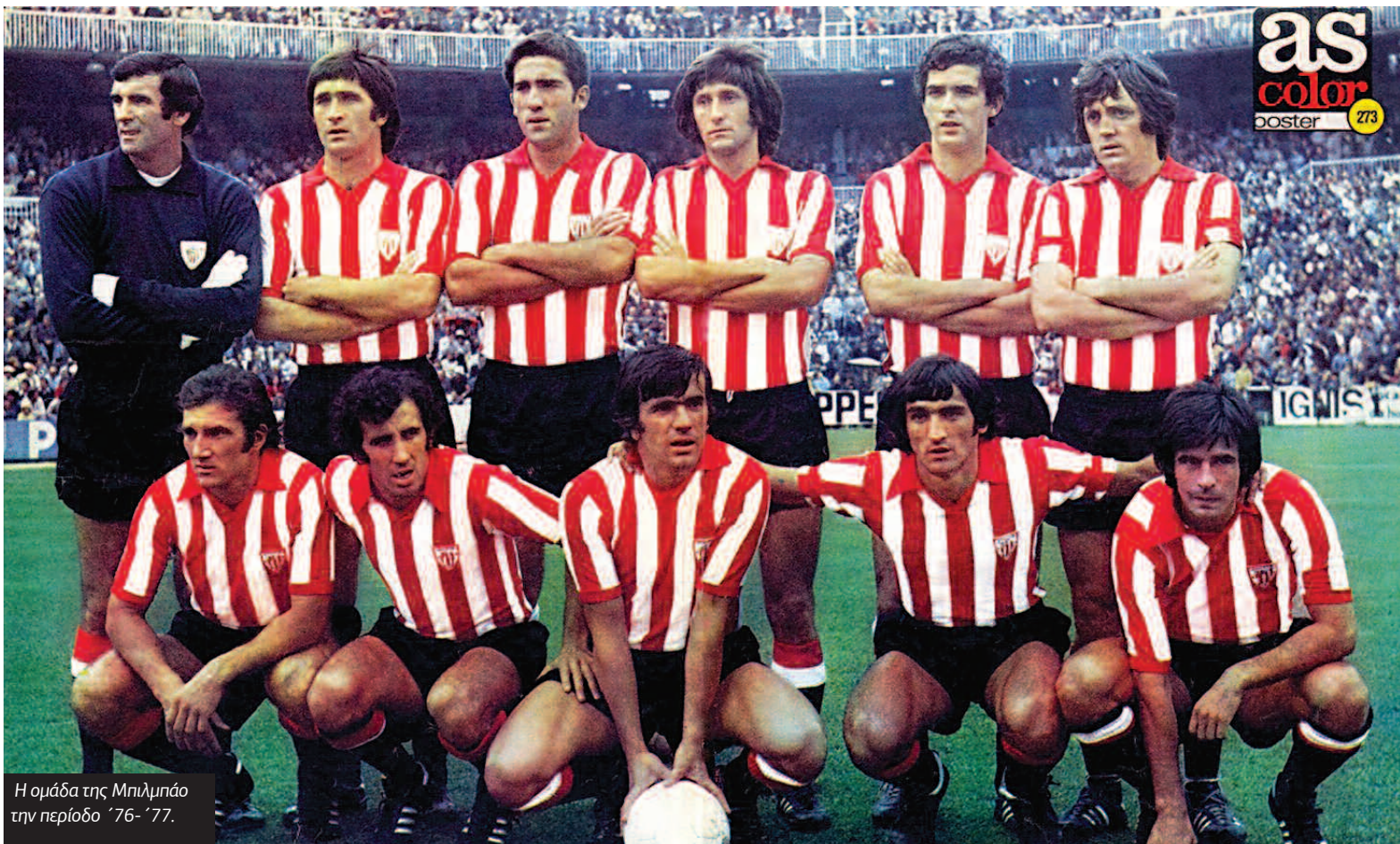
Η ομάδα της Μπιλμπάο την περίοδο '76-'77.

Στο πρωτάθλημα η Ρεάλ ήταν η κάτοχος του τίτλου, η Μπαρσελόνα το φαβορί, η Αιλέτικο το μεγάλο αουτσάιντερ. Η «Βασίλισσα» καταποντίστηκε, στο τέλος τερμάτισε 9η, η Μπιλμπάο κατάφερε ως ένα σημείο (μέχρι τον Μάρτιο) να ακολουθήσει την «Μπάρτσα» και την Αιλέτικο στην κορυφή του τίτλου, αλλά έμεινε πίσω και τερμάτισε 3η με 8 βαθμούς διαφορά από την πρωταθλήτρια