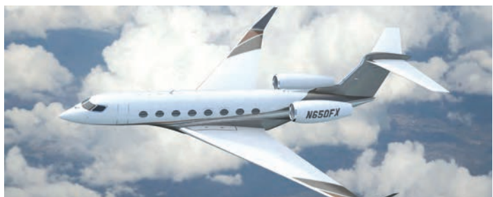
Photo of the week // Το πιο ισχυρό τζετ

Οι πλείστοι από εμάς για να κάνουμε διακοπές στο εξωτερικό χρησιμοποιούμε τις πτήσεις αεροπορικών εταιρειών. Όμως κάποιος άλλοι πιο προνομιούχοι δεν συνωστίζονται σε μικροσκοπικές καρέκλες και διαδρόμους, αλλά χρησιμοποιούν το δικό τους μέσο για να ταξιδέψουν. Το ιδιωτικό τζετ της φωτογραφίας διαθέτει την ισχυρότερη μηχανή στον κόσμο και η μέση ακτίνα δράσης του φτάνει τα 6.885 μίλια, με σταθερή ταχύτητα 561 μιλίων ανά ώρα. Το εσωτερικό του Flexjet Global Express παραπέμπει σε νεοϋορκέζικο διαμέρισμα. Τα κρυστάλλινα ποτήρια και τα δερμάτινα καθίσματα σάς μεταφέρουν στον προορισμό σας με στυλ.