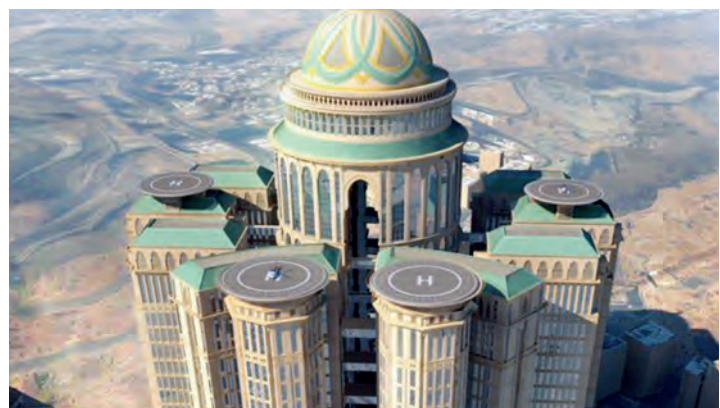
Photo of the week // Το μεγαλύτερο ξενοδοχείο στον κόσμο

Άρχισε η κατασκευή του μεγαλύτερου ξενοδοχείου στον κόσμο, που θα βρίσκεται στη Σαουδική Αραβία, δύο μόνο χιλιόμετρα μακριά από τη Μέκκα. Το ξενοδοχείο θα έχει δώδεκα πύργους και θα μοιάζει με μια πόλη. Θα διαθέτει 10.000 δωμάτια, 70 εστιατόρια, χώρους προσγείωσης ελικοπτέρων, σουίτες, ολόκληρους ορόφους με προεδρικές σουίτες, ένα τεράστιο εμπορικό κέντρο, ένα μεγάλο συνεδριακό κέντρο, χώρους στάθμευσης και στάσεις λεωφορείων. Το αρχιτεκτονικό σχέδιο, αν και μοντέρνο, έχει επιρροές από τα παραδοσιακά κάστρα της ερήμου της Σαουδικής Αραβίας. Δέκα από τους πύργους θα προσφέρουν διαμονή τεσσάρων αστέρων και οι υπόλοιποι δύο θα είναι ακόμη πιο πολυτελείς. Η έκταση του συγκροτήματος θα ανέρχεται στα 1,4 εκατ. τετραγωνικά μέτρα. Το έργο θα στοιχίσει 3,5 δισεκατομμύρια δολάρια. Το ξενοδοχείο, με την ονομασία Abraj Kudai, θα λειτουργήσει πλήρως το 2017.